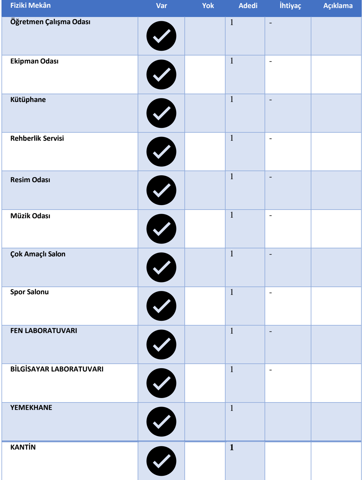
Tablo Fiziki Mekân Durumu